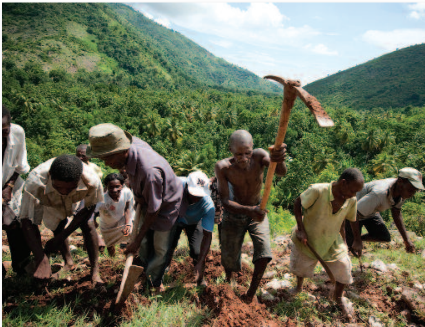
Elodie Perriot/Secours Catholique