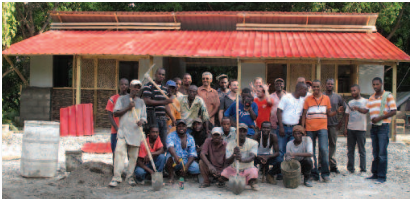
L'équipe à Gressier. Caritas Autriche