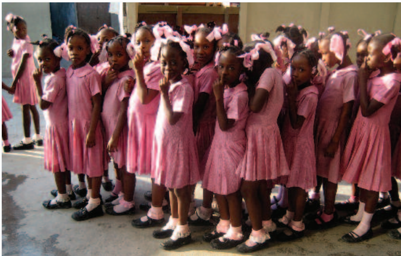
A l'école Marie-Esther à Port-au-Prince, les élèves font la queue devant une table où s'empilent des assiettes fumantes de riz et de haricots. Développement et Paix