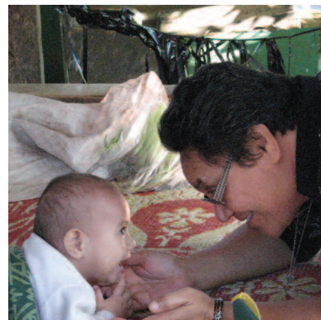
Llevando esperanza a Tonga luego del desastre de un ferry y de un tsunami.

Caritas también hace campaña en nombre de aquellos que se encuentran expuestos a devastadoras pandemias, como el VIH y el sida, la tuberculosis y el paludismo. En especial, Caritas pide mejor acceso a medicamentos antirretrovirales especiales para niños con VIH, muchos de los cuales mueren antes de cumplir dos años. Más de 100 organizaciones miembros de Caritas trabajan con personas afectadas por el VIH.