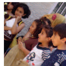
Un día de diversión para los niños de Cisjordania.

comprometidos a mejorar la calidad de nuestro trabajo – lo que hacemos y cómo lo hacemos – a través de la reflexión, la evaluación y la evolución continuas.