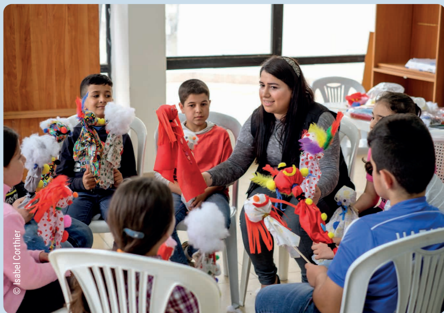
← Las mujeres dirigen una terapia por traumas para los niños sirios, en un centro comunitario del Líbano. 2016.

El cambio de la sociedad requiere cambios individuales, de cada uno de nosotros, en nuestras familias, en nuestro trabajo, en nuestras comunidades. Todos somos responsables de desafiar a nuestros líderes y cuestionar nuestras estructuras injustas.