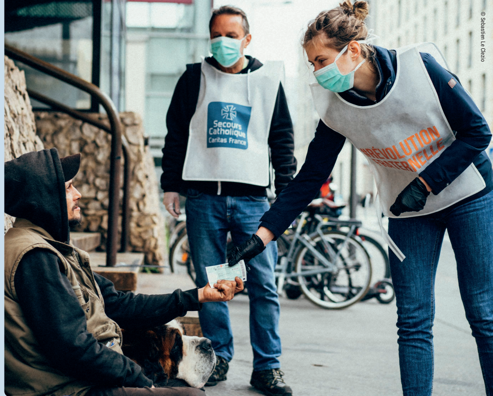
↑ Secours Catholique - Distribución de vales de servicio a personas sin hogar de Burdeos durante la crisis del coronavirus. 7 de abril de 2020.

El programa de salud se está ampliando para incluir cuatro islas exteriores. La relación de Caritas Aotearoa-Nueva Zelanda con Teitoiningaina, la Asociación Católica de Mujeres, ha demostrado ser inestimable, ya que son las principales colaboradoras en este proyecto.