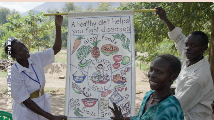
← Educación comunitaria, en Sudán del Sur. 2009