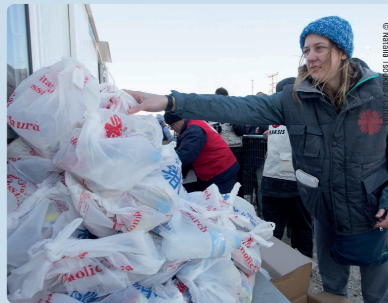
← Caritas ofrece alimentos y agua, saneamiento e higiene a los refugiados que llegan a Grecia.