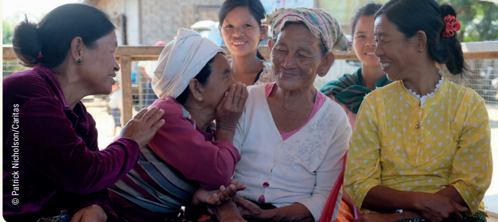
↑ Mujeres participando en un taller sobre protección de la infancia, en Myanmar. 23 de noviembre de 2017.

dad creyeron en él por las palabras de la mujer que atestiguaba: «Me ha dicho todo lo que he hecho». 40 Cuando llegaron donde él los samaritanos, le rogaron que se quedara con ellos. Y se quedó allí dos días. 41 Y fueron muchos más los que creyeron por sus palabras.