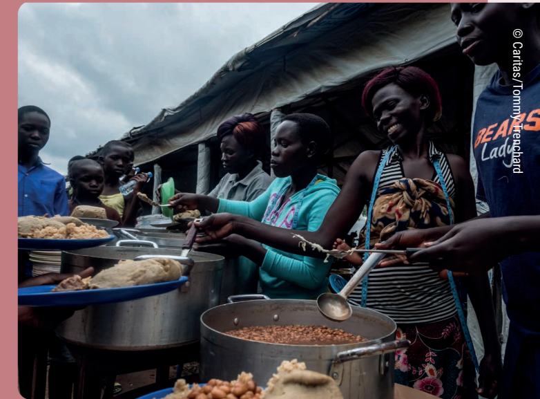
↑ Voluntarios de Caritas sirven una comida a refugiados, en el campamento de Bidi Bidi, Uganda, en el Día Internacional del Refugiado. 20 de junio de 2018.

La inclusión y la diversidad hacen que los lugares de trabajo sean más eficientes, porque permite aportar diferentes perspectivas y experiencias a las reflexiones. No podemos permitirnos desaprovecharlo. La promoción de la mujer en el liderazgo requiere compromiso, acciones concretas adhesión y apoyo a todos los niveles. La orientación y los programas de son esenciales para apoyar a las mujeres en puestos de puestos de liderazgo.